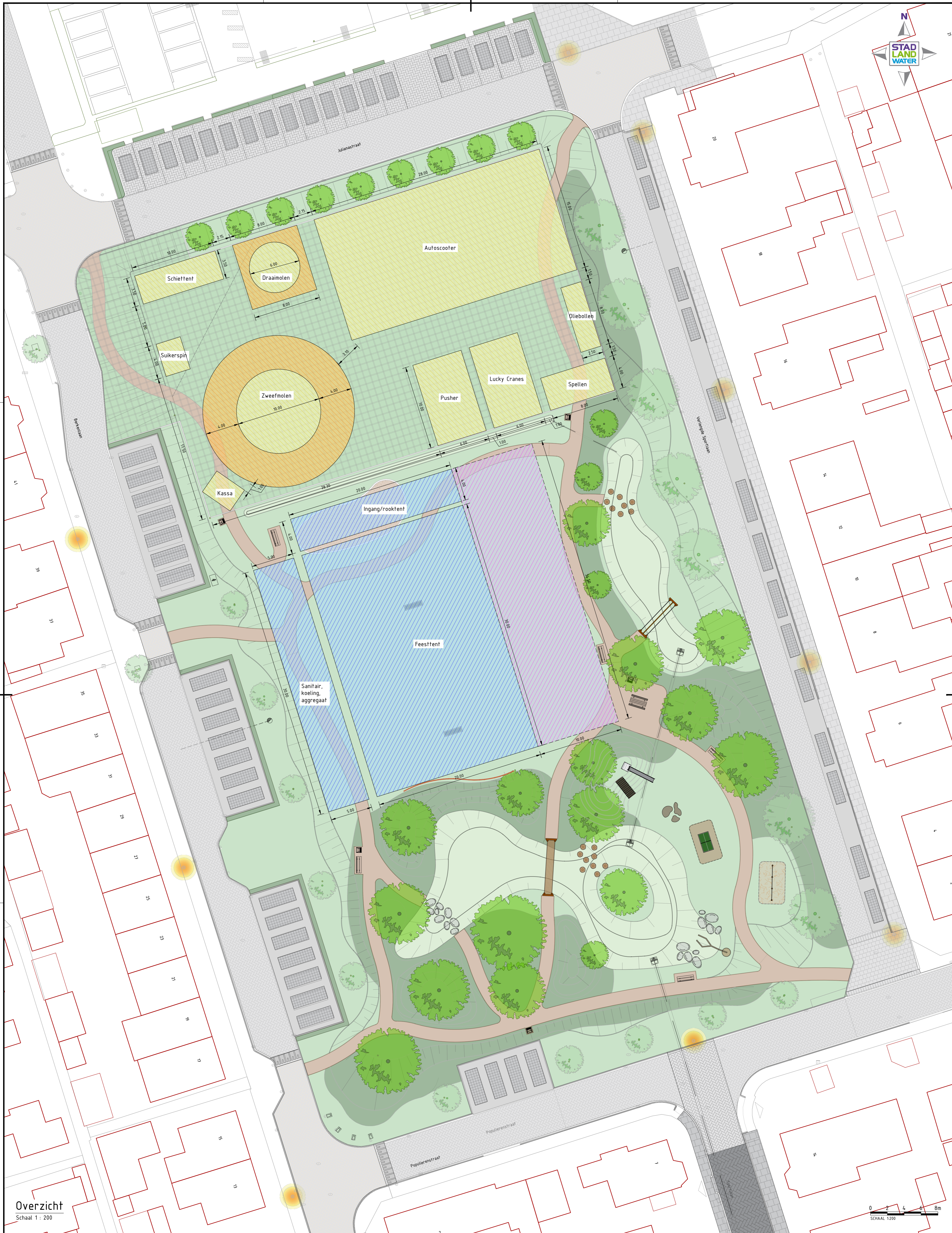
Overzicht Schaal 1 : 200